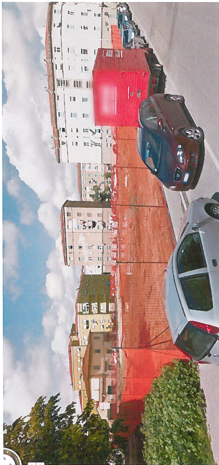
Veduta dalla Via Tito Speri