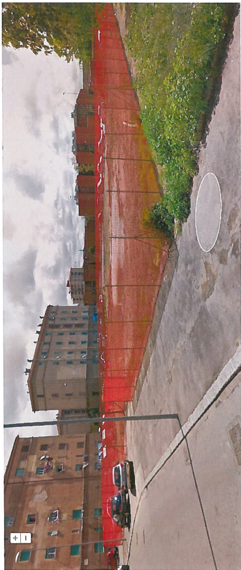
Veduta dalla Via Bixio