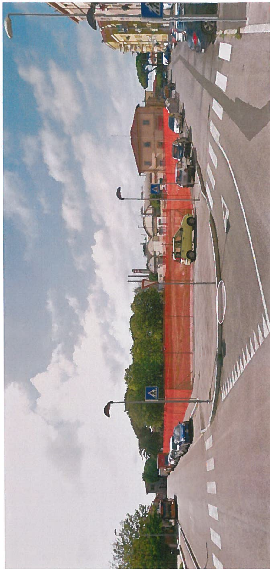
Veduta tra Via Tito Speri e Via Menotti