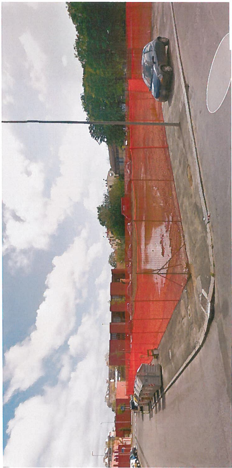
Veduta tra Via Menotti e Via Bixio