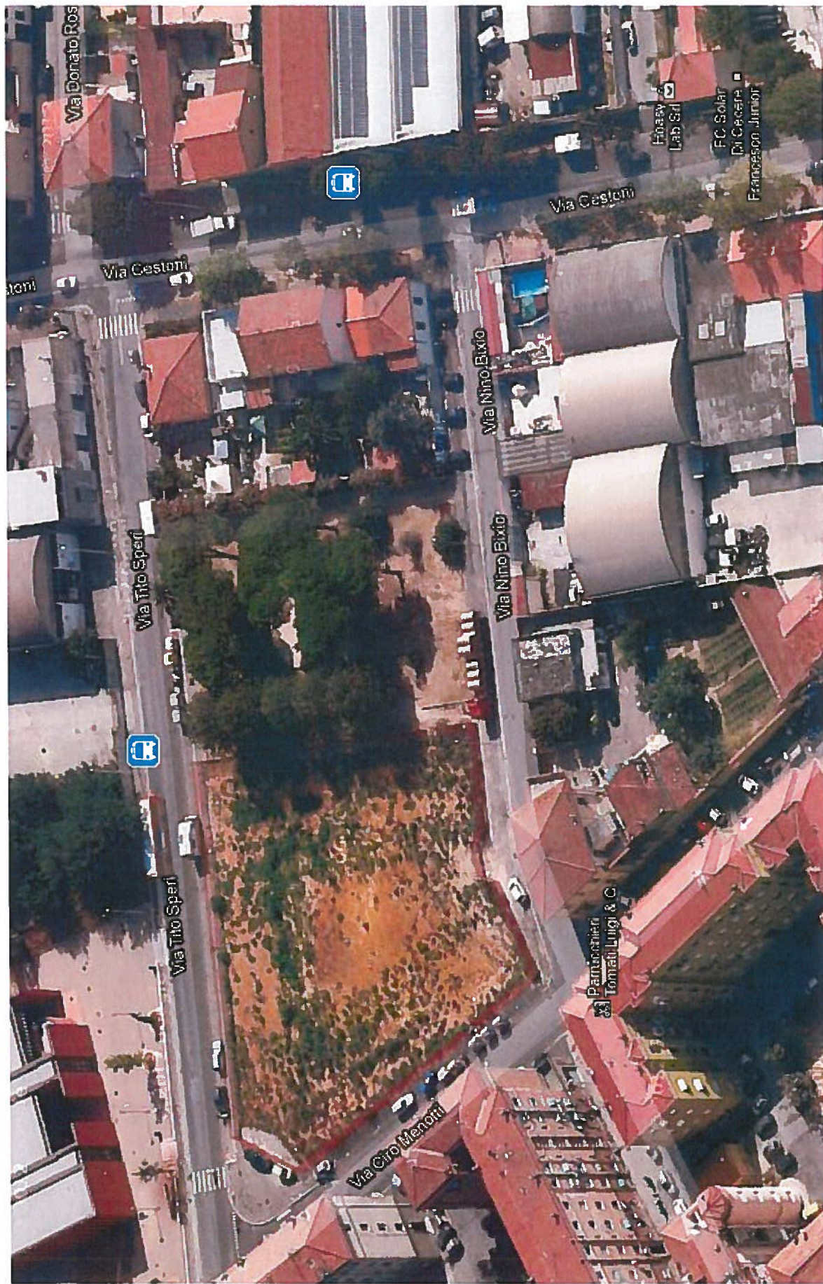
Veduta zenitale lato Via Bixio